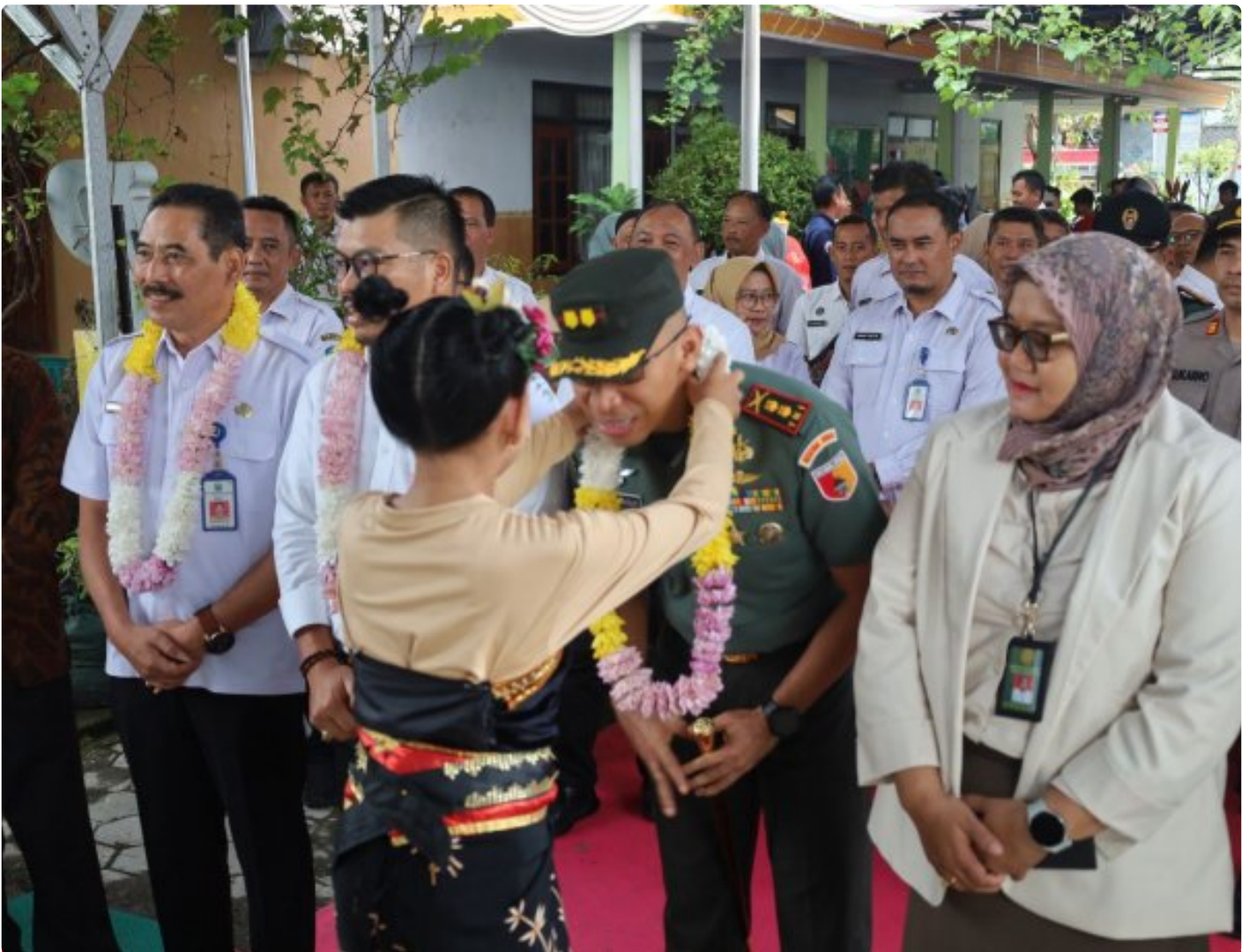
Dukung Program Pemerintah, Dandim 0804/Magetan Hadiri Musrenbang Tingkat Kecamatan